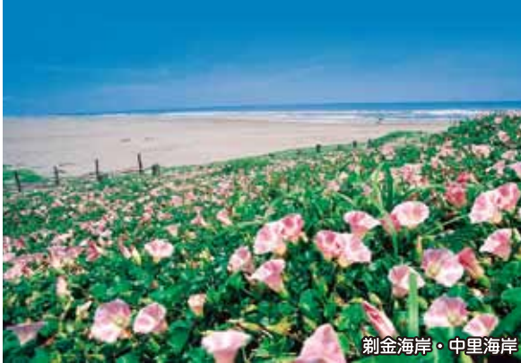
剱金海岸・中里海岸

ハマヒルガオはヒルガオ科ヒルガオ属の多年草で、主に砂浜に生育する海浜植物です。その年の陽気や場所によってかわりますが、開花時期は5月~6月頃です。 「葉を厚く、表面を固く、し、強風にも耐えられるように」一背は高くならず、這うように「生育が強い。風も強く、砂で葉や芽が埋もれてしまうと、さらに茎が伸びて砂の表面に顔を出します。淡いピンク色のハマヒルガオはアサガオよりも小さく、砂浜で一生懸命生きていると思うと優しい言葉をかけてあげたくありませんね。外房エリアの海岸でもかわいいハマヒルガオを見る事ができます。砂浜で頑張りかわい花を見にお出かけしてみたいか?」