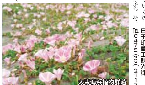
太東海浜植物群落

【海浜植物】 海岸で生育できるだけに、いろいろな特徴をもっています。海岸といえは? 水が少なく、日差しが強い。風も強く、砂も移動しやすい。人